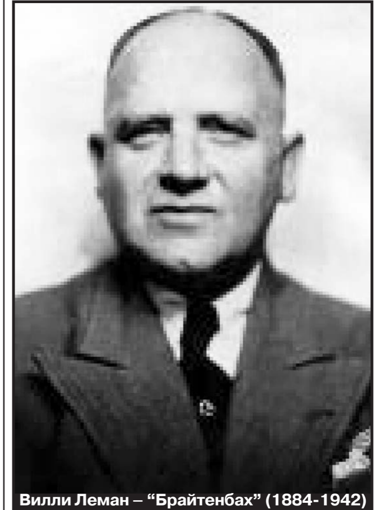
Вилли Леман – “Брайтенбах” (1884-1942)