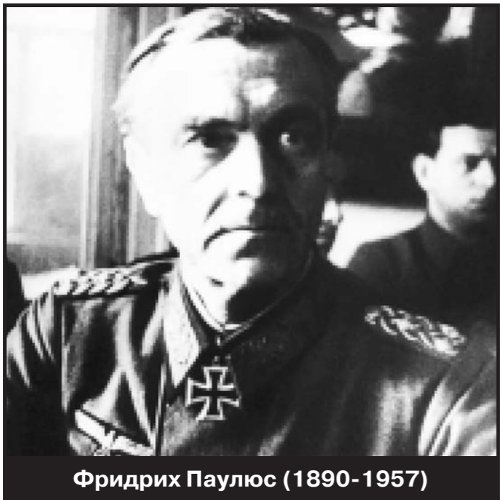
Фридрих Паулюс (1890-1957)

В своё время фельдмаршал Фридрих Паулюс рассказывал, что было несколько причин переноса сроков вторжения вермахта на Британские острова.