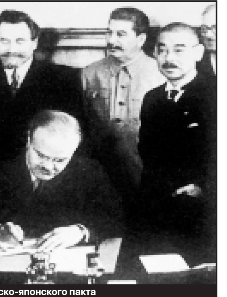
Подписание советско-японского пакта

У Сталина, конечно, имелось достаточно оснований для таких заявлений – сколько уже было сообщений от разведки, начиная с весны, что вот-вот...завтра...скоро...буквально. О дате нападения гитлеровской Германии шла противоречивая информация – и от Рихарда Зорге, и от “Красной капеллы”, и из других источников. Широко растиражированная (благодаря кино) сцена, где якобы Зорге сообщает точную дату нападения вермахта – 22 июня – это миф, давно уже разоблаченный.