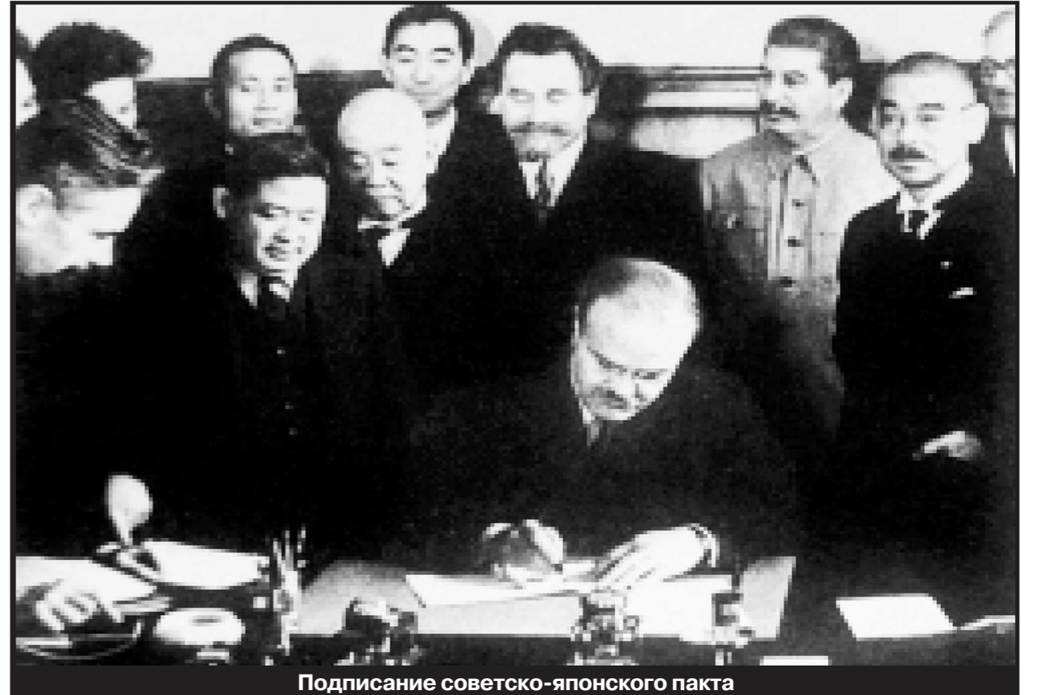
Подписание советско-японского пакта

Как вспоминал Молотов: “...Япония сильно обиделась на Германию, когда Гитлер без согласования с ней подписал с